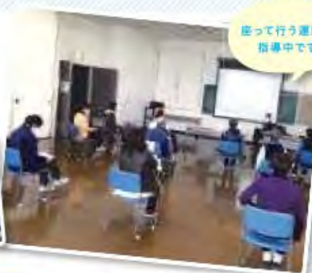
座って行う運動の指導中です