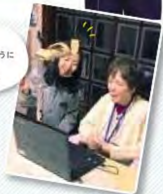
※2018年撮影 現在は感染予防対策として、マスク着用、手指消毒を行っています。