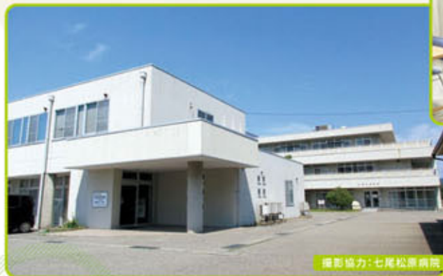
撮影協力:七尾松原病院