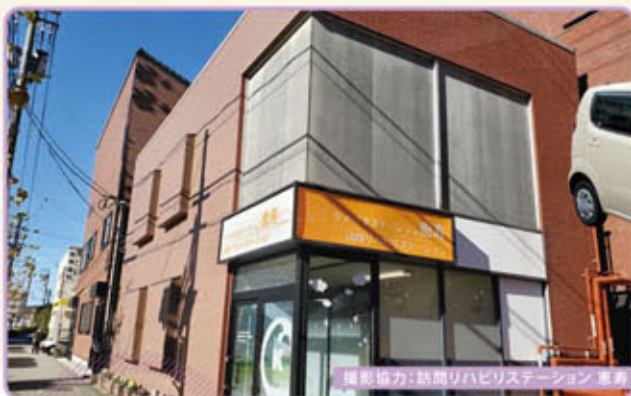
撮影協力:訪問リハビリステーション 車庫