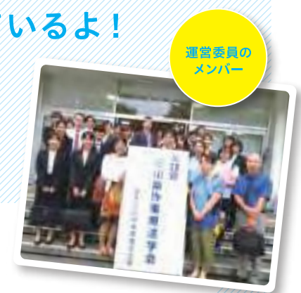
運営委員のメンバー

2019年度で28回目の学会開催となりました。毎年県内の作業療法士が大勢集まっています。資格取得後も、日々の臨床現場での実践報告や研究報告・意見交換を行い、患者様のため勉強に励んでいます。