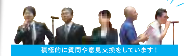
積極的に質問や意見交換をしています!

他にも中高生向けの作業療法体験セミナーの報告や、医師や看護師など他職種と連携を深めるための勉強会報告など幅広い分野の発表をしています。